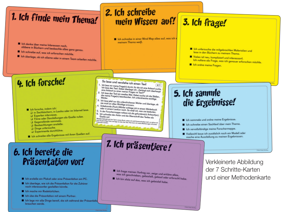
Verkleinerte Abbildung der 7 Schritte-Karten und einer Methodenkarte

Die Materialien zeichnen sich durch innere Differenzierung aus. Sie sind daher zum vielfältigen Einsatz über viele Schuljahre hinweg geeignet. Jedes Kind kann auf seinem individuellen Lernniveau arbeiten. Die Materialien sind unabhängig von einem Thema oder Fachgebiet anwendbar, sodass sie gemäß der Situation in Ihrer Schule und den Bedürfnissen Ihrer Kinder eingesetzt werden können.