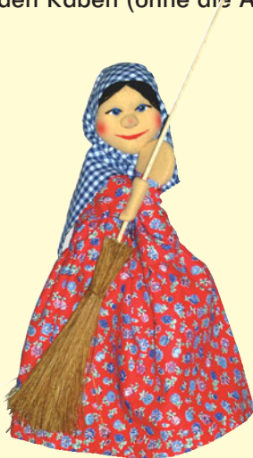
Handpuppe „Lulu“ Best.-Nr.:140 269

Wir bieten Ihnen die Handpuppe Lulu (in einem anderen Outfit) und Fingerpuppen des Affen und der beiden Raben (ohne die Accessoires Hose, Halstuch und Kette). Liefermöglichkeit begrenzt!