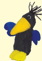
Fingerpuppen Raben „Lola/Uli“ Best.-Nr.:140 279