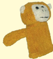
Fingerpuppe Affe „Ali“ Best.-Nr.:140 278